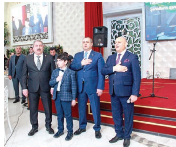
Aprel 5-də Bakının Nərimanov rayonunda şəhid ailələri və qazilər üçün iftar məclisi təşkil olunub.

Milli Məclisin Mətbuat və İctimaiyyətlə əlaqələr şöbəsinin verilməsinə görə, Bakıdan, ayrı-ayrı şəhər və rayonlarımızdan təşrif buyurmuş şəhid ailələrinin, qazilərin, millət vəkiliyərinin, ictimaiyyət nümayəndələrinin iştirakı ilə keçirilən tədbirdə öncə şəhidlərimizin əziz xatirəsi bərdəqəliklə sükutla yad edilib, daha sonra Azərbaycan Respublikasının Dövlət Himni səsləndirilib.