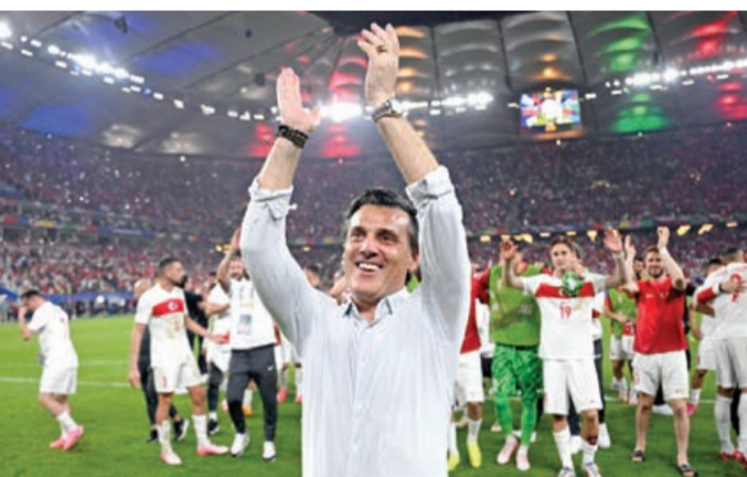
Türkiyə millisinin baş məşqçisi Vincenzo Montella Çexiyaya qalib gəlməkləri və 1/8 finala adlanmaları barədə danışıb.

Mütəxəssis belə bir uğura imza atdıqları üçün çox xoşbəxt olduğunu deyib: "Millətimiz, futbolçularımız, xalqımız adına çox xoşbəxtəm. Komandanın üzərində lazımsız təzyiqlər yaranmışdı. Çexiyanın qolu qeyd alınmamalı idi. Bəlkə də 1/8 finala adlayan ən gənc komanda bizik. Barış Alper Yılmaz çox yaxşı oynadı. Komandamızda sonadək mübarizə aparmayan bir futbolçu belə tapa bilməzsiniz".