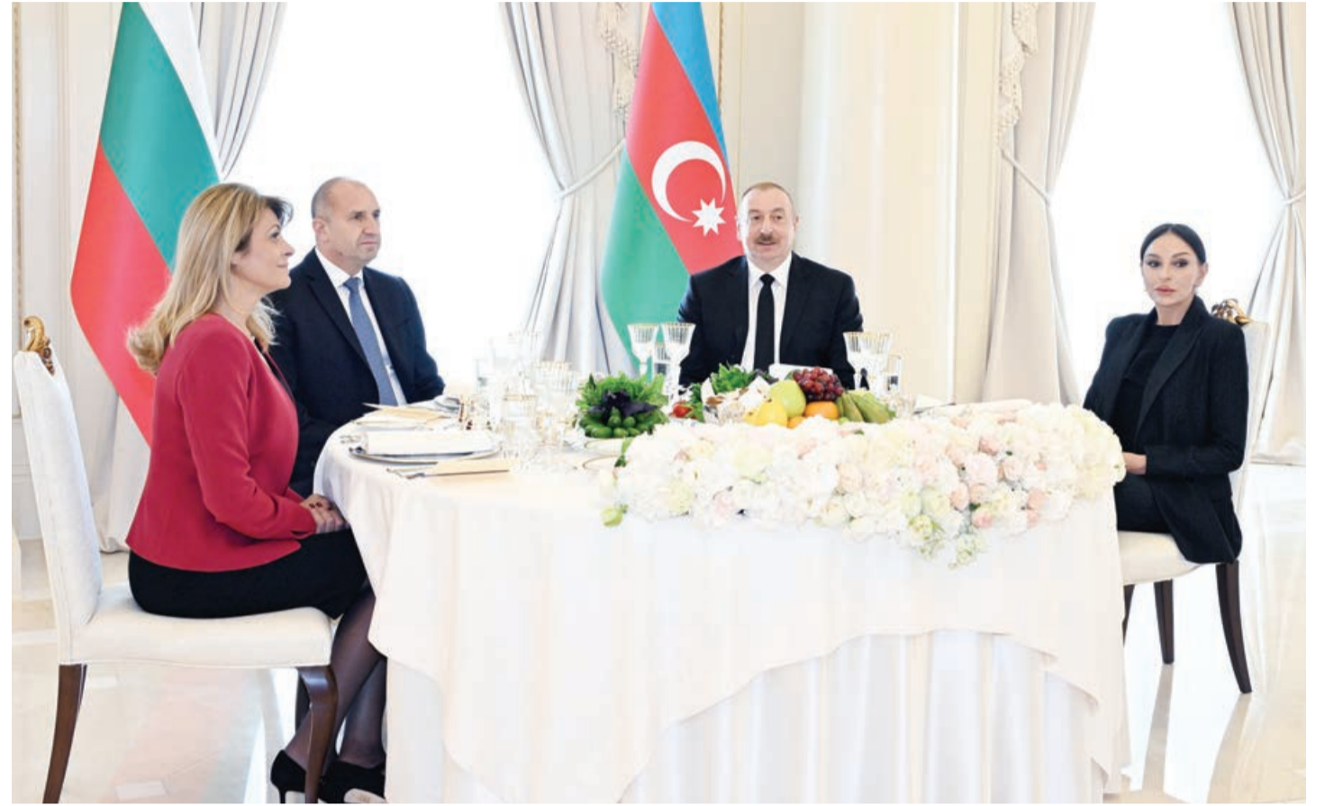
Mayın 8-də Azərbaycan Respublikasının Prezidenti İlham Əliyevin və birinci xanım Mehriban Əliyevanın adından Bolqarıstan Respublikasının Prezidenti Rumen Radevin və birinci xanım Desislava Radevanın şərəfinə rəsmi nahar verilib.