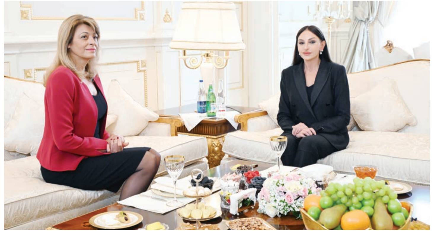
Mayın 8-də Azərbaycan Respublikasının birinci xanımı Mehriban Əliyevanın Bolqarıstan Respublikasının birinci xanımı Desislava Radeva ilə görüşü olub.