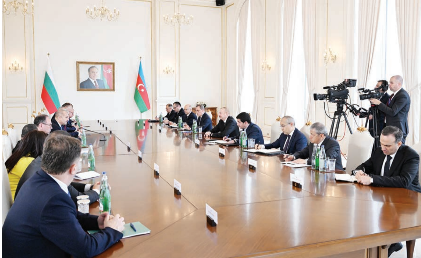
Əvvəli 2-ci sah.

Biz şadıq ki, hazırda Bolqarıstan və Azərbaycan enerji təhlükəsizliyi məsələləri üzərində sıx şəkildə çalışır. Bizim Bolqarıstana qaz təchizatımız artır. Ümidvaram ki, bu il də artım müşahidə edəcəyik. Biz, həmçinin "yaşıl gündəlik" üzərində birlikdə işləyirik. Mən cənab Prezidenti COP29-da iştirak etməyə dəvət etdim və onu noyabrda yenidən görməyə şad olaram. Eyni zamanda "yaşıl enerji" kabeli layihəsində heyətlərimiz sıx şəkildə işləyirlər. Əminəm ki, səfərin yaxşı nəticələri olacaq və tərəfdaşlığımız uğurla davam edəcək. Beləliklə, cənab Prezident, bir daha Azərbaycana xoş gəlmisiniz.