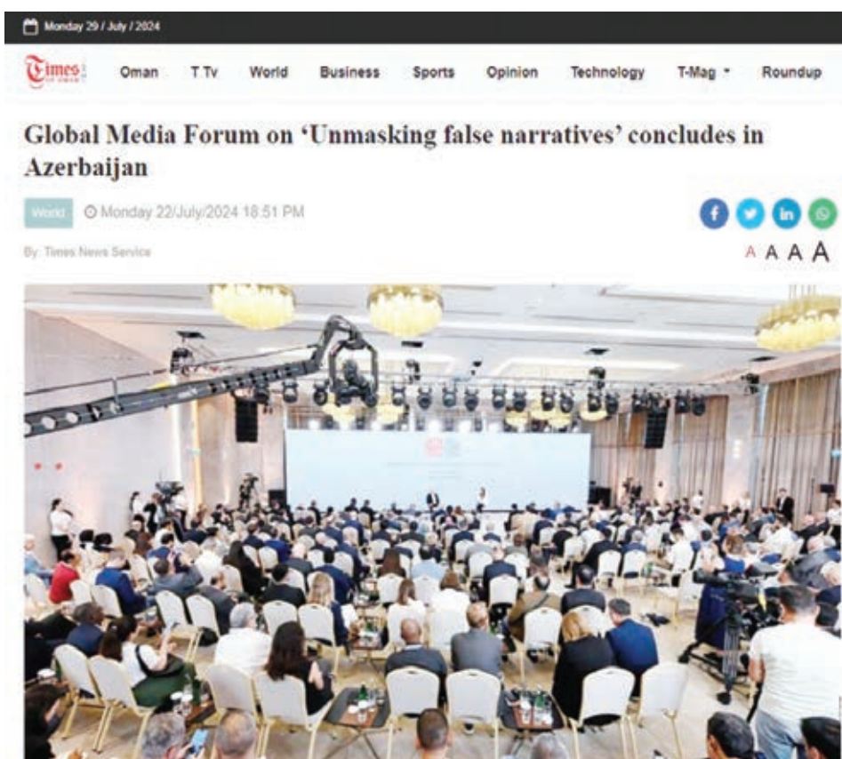
Shusha (Azərbaycan): Shusha, a major centre of Azerbaijani culture and music, saw the culmination of the II Global Media Forum on Tuesday (July 22, 2024).

Yazıda dövlətimizin başçısının Azərbaycanın bərpaolunan enerji sahəsində atılan addımlar, ölkəmizin zəngin "yaşıl enerji" potensialı barədə fikirlərinə də geniş yer verilib: "Biz ən böyük günəş-elektrik stansiyası - 230 meqavat gücündə stansiyayı istifadəyə verdik. İndi isə 240 meqavatlıq külək-elektrik enerjisi stansiyası ilə bağlı işlər yekunlaşır və tezliklə biz 240 meqavatlıq günəş-elektrik stansiyasının açılışını edəcəyik. Birinci layihə "Masdar" şirkəti, ikinci layihə isə "Acwa Power" şirkəti tərəfindən həyata keçirilir. Üçüncüsü isə BP tərəfindən inşa ediləcək. Yəni bunlar dünyanın aparıcı enerji şirkətləridir. Bununla yanaşı, ötən ay Bakıda biz üç günəş və külək-elektrik stansiyasının təməlini qoyduq, ümumi həcm bir qıqavattır. Biz bu sahədə çox böyük işlər görürük. Böyük potensialımız var, həm texniki, həm də iqtisadi potensialımız. Texniki baxım-