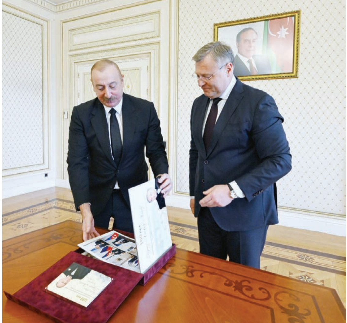
Əvvəli 1-ci sah.