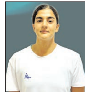
Məryəm Şeyxəlizadəxangah üzgüçülük