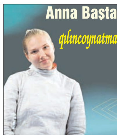
Anna Baştə qılıncoymatma