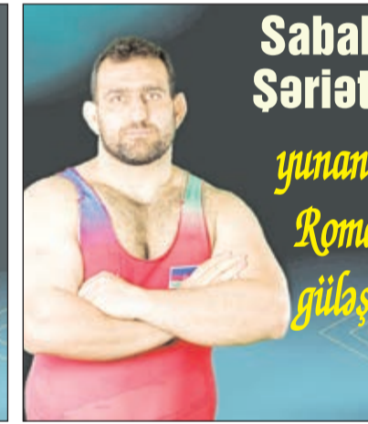
Sabah Şəriəti yunan- Roma gülaşi