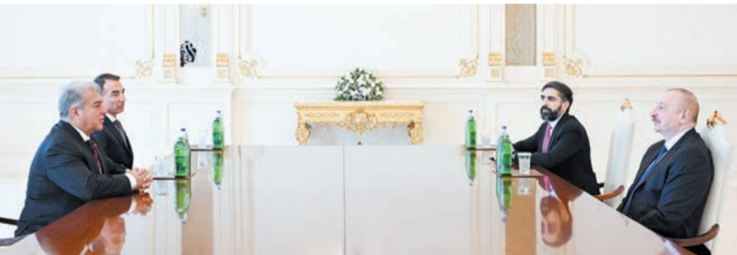
Azərbaycan Respublikasının Prezidenti İlham Əliyev martın 1-də "Barselona" Futbol Klubunun prezidenti Xuan Laportamı qəbul edib.

Prezident İlham Əliyev "Barselona" Futbol Klubunun prezidentini qəbul edib