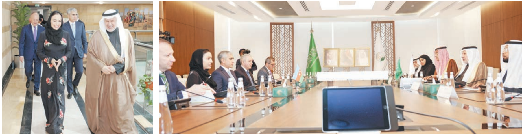
Heydər Əliyev Fondunun vitse-prezidenti Leyla Əliyeva Ər-Riyadda Səudiyyə Ərəbistanının Kral Salman Humanitar Yardım və Qayğı Mərkəzinin rəhbəri Abdullah Ər-Rabie ilə görüşüb.

AZƏRTAC xəbər verir ki, görüşdə Azərbaycanla Səudiyyə Ərəbistanı arasında əlaqələrin yüksək səviyyədə ol-