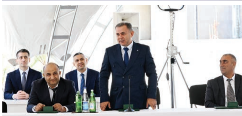
Əvvəli 3-cü səh.

Sonra çarların təqdim edilməsi mərasimi oldu.