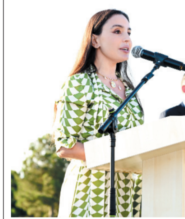
Heydər Əliyev Fondunun vitse-prezidenti, IDEA İctimai Birliyinin təsisçisi və rəhbəri Leyla Əliyevanın təşəbbüsü ilə Azərbaycanın ümumtəhsil müəssisələrinin müəllimlərinə həsr olunan Xeyirxahlıq Festivalı keçirilib.

IDEA İctimai Birliyi, Azərbaycan Respublikasının Elm və Təhsil Nazirliyi və "ThinkIn" təşkilatının əməkdaşlığı çərçivəsində təşkil edilən tədbirdə ölkənin 290 ümumtəhsil müəssisəsindən 1000-ə yaxın müəllim iştirak edib.