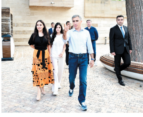
İyunun 26-da Dənizkənarı Milli Park ərazisində bir sıra layihənin təqdimat mərasimləri keçirilib.

AZƏRTAC xəbər verir ki, mərasimlərdə Heydər Əliyev Fondunun vitse-prezidenti Leyla Əliyeva və Bakı Media Mərkəzinin rəhbəri Arzu Əliyeva iştirak ediblər.