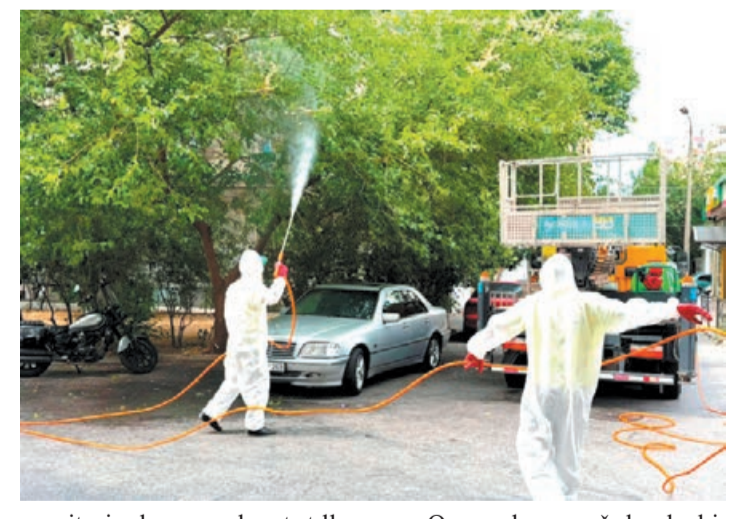
monitorinqlər aparılır, tırtılların aşkar edildiyi yerlərdə isə xüsusi vasitələrlə dərmanlama işləri həyata keçirilir.

Paytaxtın bəzi ərazilərində, ağaclarda qurdların kütləvi şəkildə müşahidə olunması ilə bağlı mübarizə tədbirləri davam etdirilir. Bakı Şəhər Yaşıllaşdırma Təsərrüfatı Birliyindən (YTB) bildirilib ki, məsələ ilə əlaqədar mütəxəssislər qurdların müşahidə edildiyi ərazilərə baxış keçiriblər.