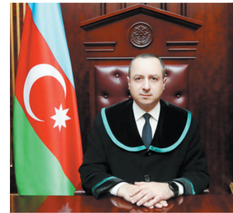
İnsan hüquqları üzrə Avropa Məhkəməsinin qərarı

Bununla əlaqədar bildirilməlidir ki, "Çıraqov və digərləri Ermənistan qarşı" iş üzrə 2016-cı il 16 iyun tarixli qərarında Avropa Məhkəməsinin Azərbaycan tərəfinin bir hissəsinin Ermənistan Respublikası tərəfindən faktiki işğal olunmasını etiraf etməsinə baxmayaraq, hazırkı qərar 2020-ci ilin noyabrına qədər işğal altında olmuş ərazilərin "DQR" adlandırılması məntiqli uzaqlaşdır. Avropa Məhkəməsinin 2016-cı il tarixli qərarında birmənalı olaraq qeyd edilmişdir ki, Ermənistan Respublikasının silahlı qüvvələri Azərbaycan ərazisində yerləşdirilib, Ermənistanın dövlət büdcəsinin xeyli hissəsi həmin ora-