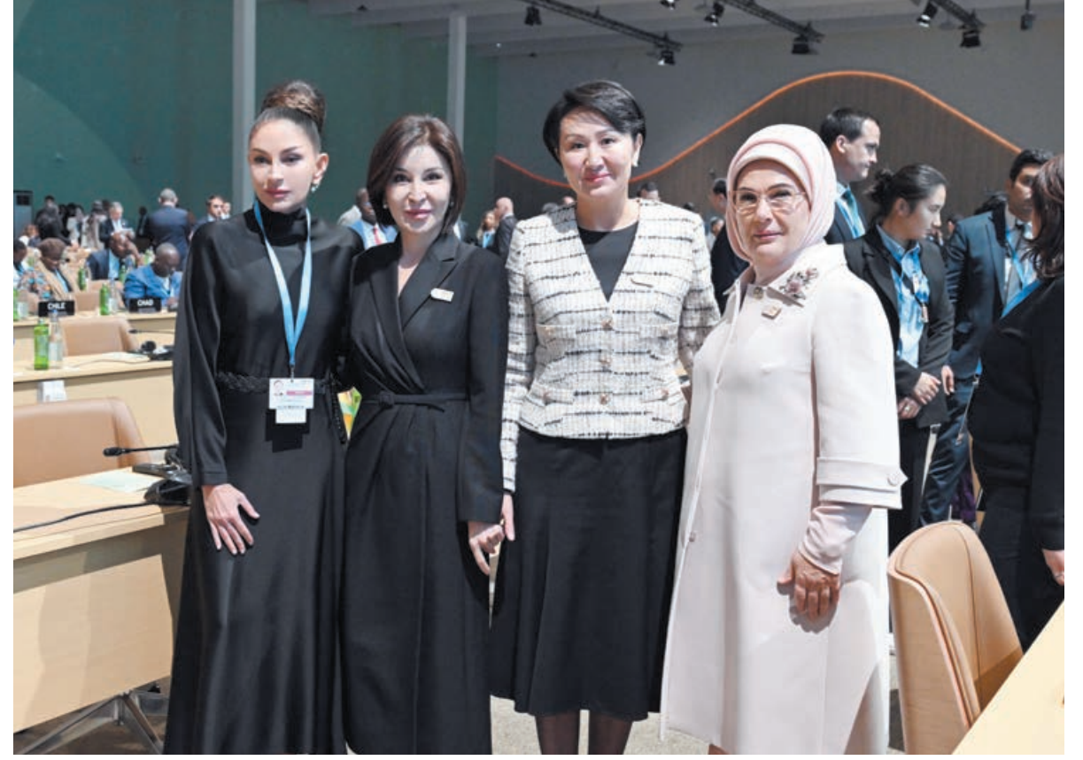
Əvvəli 5-ci sah.

Cənab Prezident, COP29-a Azərbaycanda, Bakıda evsahibliyi etdiyinizə görə təşəkkür edirəm. Siz həqiqətən də öz rəhbərliyiniz və lideriyinizlə hamını sülhün vacibliyinə inandırdınız. Sülh olmadan dayanıqlı inkişaf barədə danışmaq mümkün deyil. Dayanıqlı inkişaf olmadan da biz sülhü yarada bilmərik. Mən Azərbaycana Dayanıqlı İnkişaf Məqsədlərinə verdiyi töhfələrə görə təşəkkür edirəm. Siz öz şəhərlərinizi yenidən bərpa edirsiniz. Bunu Dayanıqlı İnkişaf Məqsədlərinə əsasən edirsiniz.