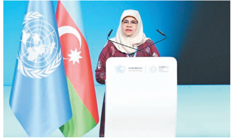
Ardı 6-cı səh.

Beləliklə, bütün dövlət nümayəndə- rinə müraciət etmək istəyirəm ki, artıq itirməyə vaxtımız qalmayıb. İnsanlar, dövlətlər iqlim dəyişmələrinə qarşı mü- barizə üçün vəsait ayırmalıdır. Əks hal- da bu, bəşəriyyətə baha başa gələcək. İq- lim maliyyə təşəbbüsü xeyirxah əməl deyil, bu, bir investisiyadır. Bu, ixtiyari məsələ deyil, məcburi məsələdir. Hər ikisi əvəz- olunmaz tədbirdir, bunlar bəşəriyyətin gələcəyi və firavanlığı üçün lazımdır. Vaxt gədir, sizə inanıram, sizə təşəkkürü- mü bildirirəm.