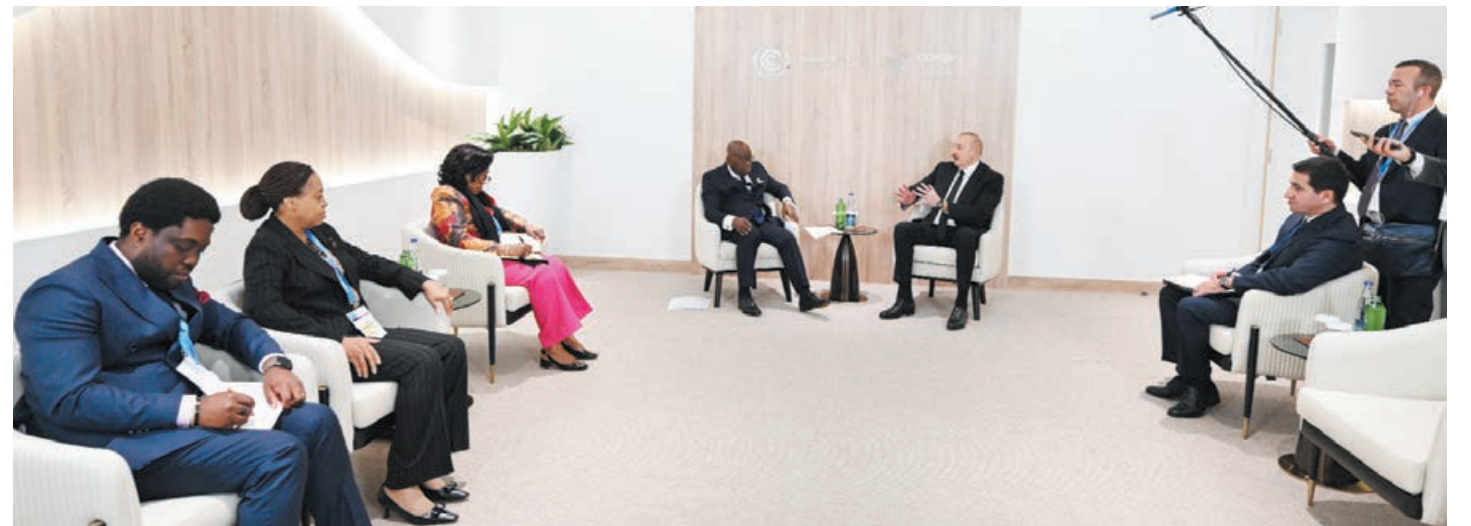
Azərbaycan Respublikasının Prezidenti İlham Əliyev noyabrın 12-də Qana Respublikasının Prezidenti Nana Addo Dankwa Akufo-Addo ilə görüşüb.

AZƏRTAC xəbər verir ki, Prezident İlham Əliyev dəvəti qəbul edib COP29 tədbirində iştirak etdiyinə görə Nana Addo Dankwa Akufo-Addoya minnətdarlığını bildirdi. Dövlətimizin başçısı qeyd etdi ki, Qana Prezidentinin ölkəmizə bu səfəri əlaqələrimizin perspektivlərinin və əməkdaşlığımızın mümkün istiqamətlərinin müəyyənləşdirilməsi üçün yaxşı imkan yaradır.