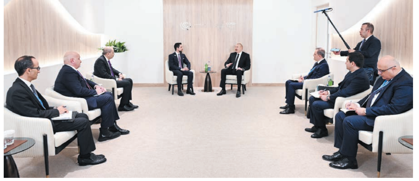
Azərbaycan Respublikasının Prezidenti İlham Əliyev noyabrın 12-də İordaniya Haşimilər Krallığının Vəliəhd Şahzadə II Əl-Hüseyn bin Abdullah ilə görüşüb.

AZƏRTAC xəbər verir ki, Vəliəhd Şahzadə II Əl-Hüseyn bin Abdullah atası - İordaniya Haşimilər Krallığının Kralı II Abdullah ibn Əl-Hüseynin salamlarını