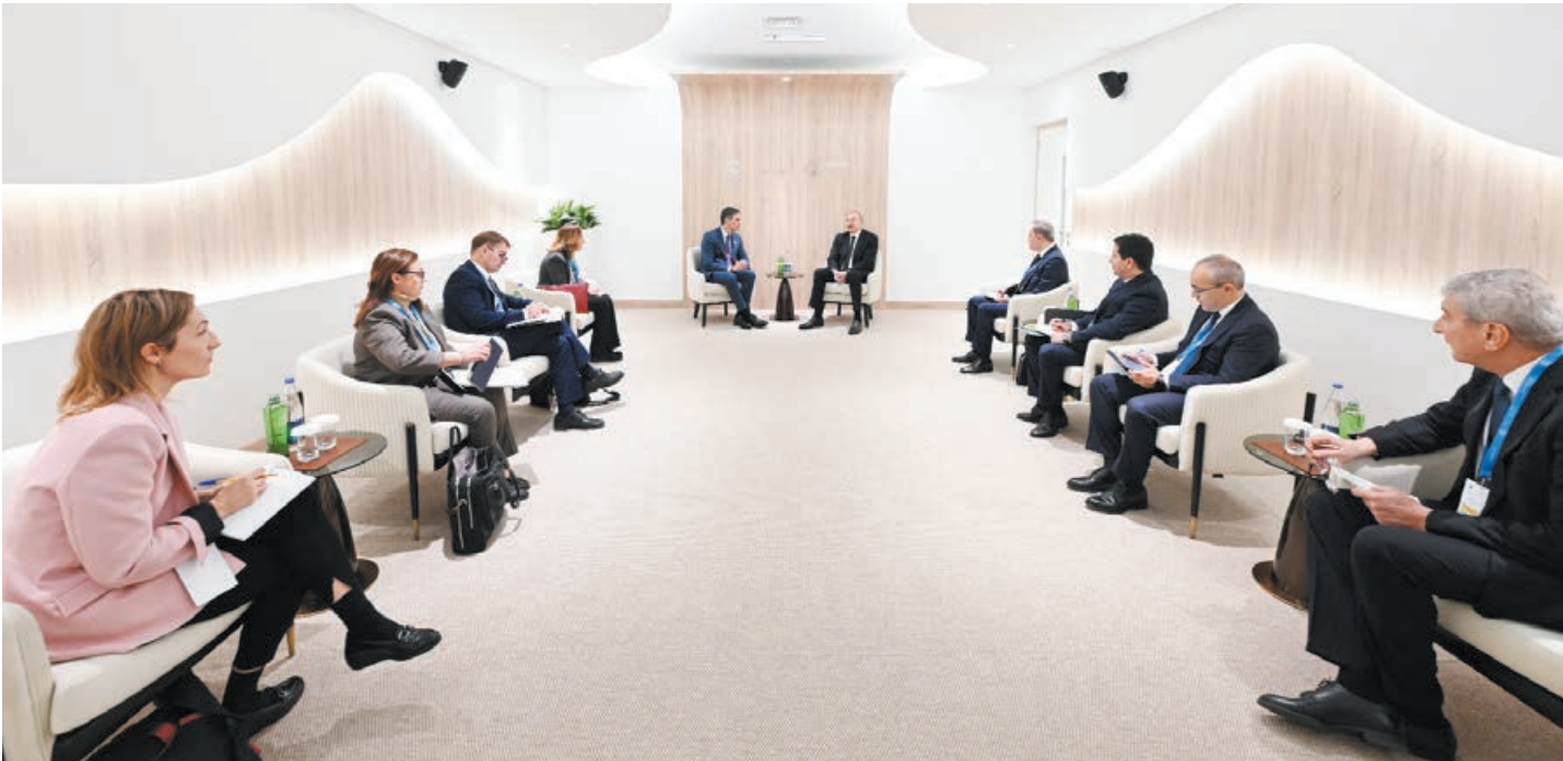
Azərbaycan Respublikasının Prezidenti İlham Əliyev noyabrın 12-də İspaniya Krallığı Hökumətinin Sədri Pedro Sançez ilə görüşüb.

AZƏRTAC xəbər verir ki, Prezident İlham Əliyev İspaniyada baş vermiş güclü daşqınlar nəticəsində çoxsaylı insan tələfatı və dağıntılarla bağlı başsağlığını çatdırdı.