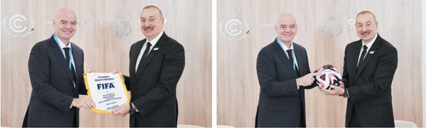
Azərbaycan Respublikasının Prezidenti İlham Əliyev noyabrın 12-də FIFA-nın prezidenti Canni İnfantino ilə görüşüb.

AZƏRTAC xəbər verir ki, əvvəlcə FIFA-nın prezidenti xatirə hədiyyələrini və xüsusilə olaraq hazırlanmış, üstündə Azərbaycan Prezidentinin adı və soyadı olan topu dövlətimizin başçısına təqdim etdi.