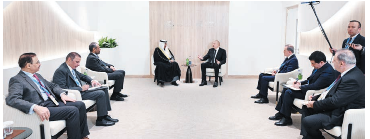
Azərbaycan Respublikasının Prezidenti İlham Əliyev noyabrın 12-də Küveyt Dövlətinin Vəliəhd Şeyx Sabah Xalid əl-Həməd əl-Sabah ilə görüşüb.

AZƏRTAC xəbər verir ki, qonaq Prezident İlham Əliyevə BMT-nin İqlim Dəyişmələri üzrə Çərçivə Konvensiyasının Tə-