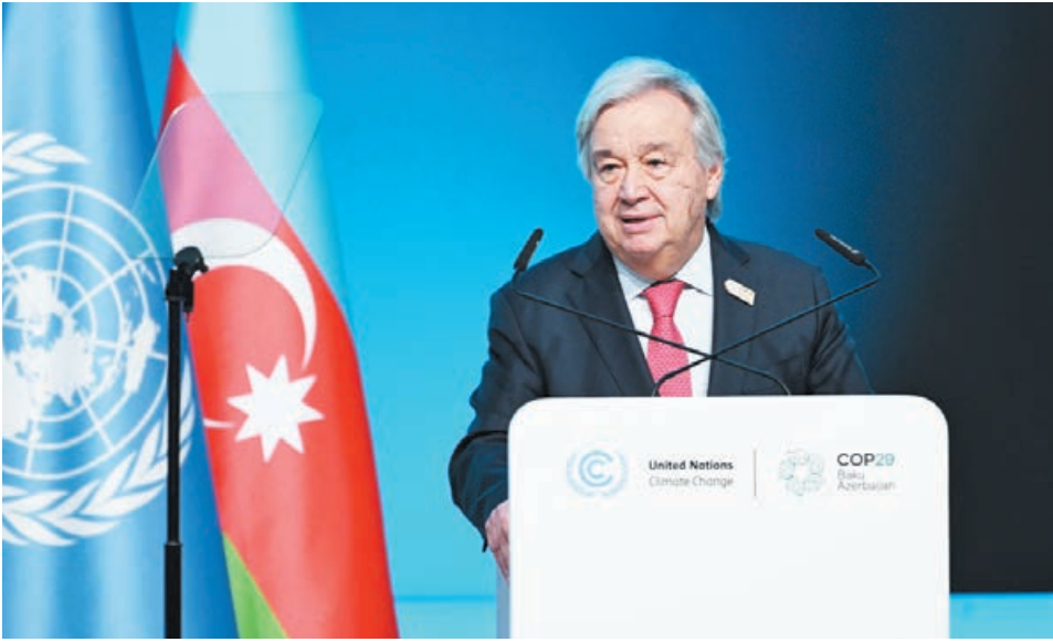
Əvvəlki 4-cü səh.

Sonra BMT-nin Baş katibi Antonio GUTERREŞ çıxış edərək dedi: