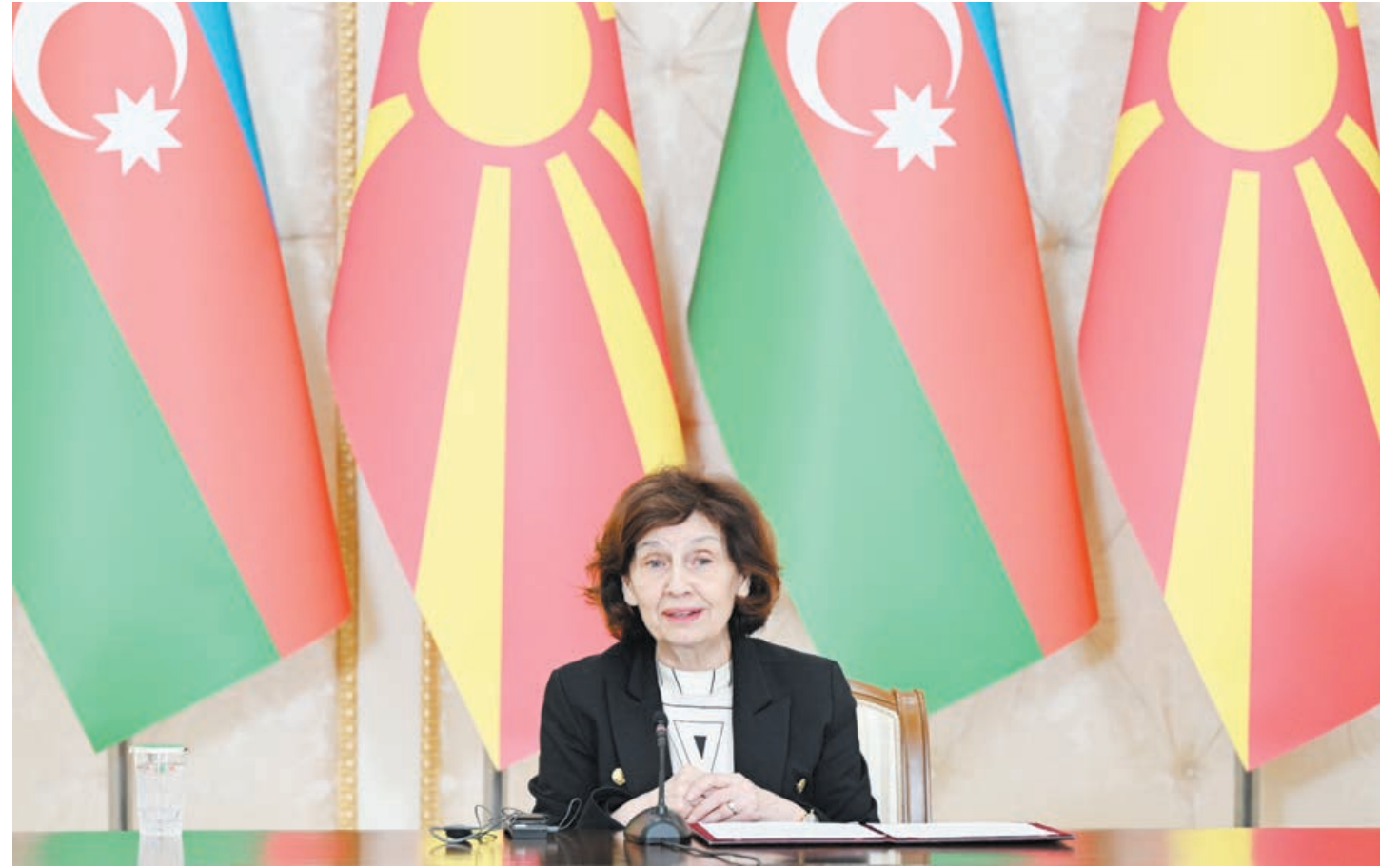
Prezident Qordana Silyanovska-Davkovanın bəyanatı

Sonra Şimali Makedoniyanın Prezidenti bəyanatla çıxış etdi.