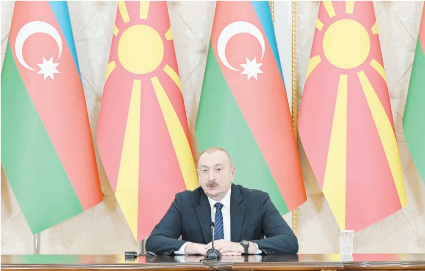
Prezident İlham Əliyevin bəyanatı

Azərbaycan və Şimali Makedoniya prezidentləri mətbuata bəyanatlarla çıxış ediblər