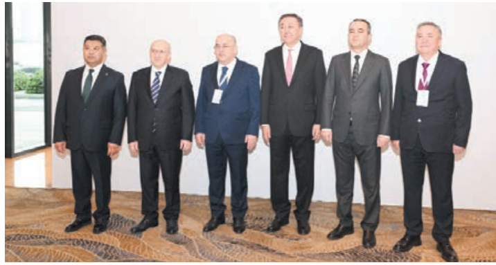
Bakıda Türk Dövlətləri Təşkilatının Gömrük Xidməti Rəhbərlərinin 10-cu iclası keçirilib.

AZƏRTAC xəbər verir ki, Azərbaycan, Türkiyə, Qazaxıstan, Özbəkistan və Qırğızıstan gömrük xidmətləri rəhbərlərinin iştirak etdiyi iclasda BMT-nin, Beynəlxalq Avtomobil Nəqliyyatı İttifaqının, Gürcüstan və Macarıstan gömrük xidmətlərinin nümayəndələri də iştirak ediblər.