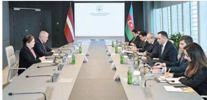
Azərbaycan Respublikasının İqtisadiyyat Nazirliyi və Latviya Respublikasının Dövlət Gəlirlər Xidməti arasında məlumat mübadiləsi və vergi tələblərinin alınmasında yardım haqqında Anlaşma Memorandumu imzalanıb.

Nazirlərdən AZƏRTAC-a bildirilib ki, tərəflər ikitərəfli iqtisadi əlaqələrin inkişafının önəmini vurğulayaraq, yeni əməkdaşlıq imkanlarının müəyyənəndirilməsi ilə bağlı fikir mübadiləsi aparıblar. Görüş çərçivəsində "Azərbaycan Respublikasının İqtisadiyyat Nazirliyi və Latviya Respublikasının Dövlət Gəlirlər Xidməti arasında məlumat mübadiləsi və vergi tələblərinin alınmasında yardım haqqında Anlaşma Memorandumu" imzalanıb.