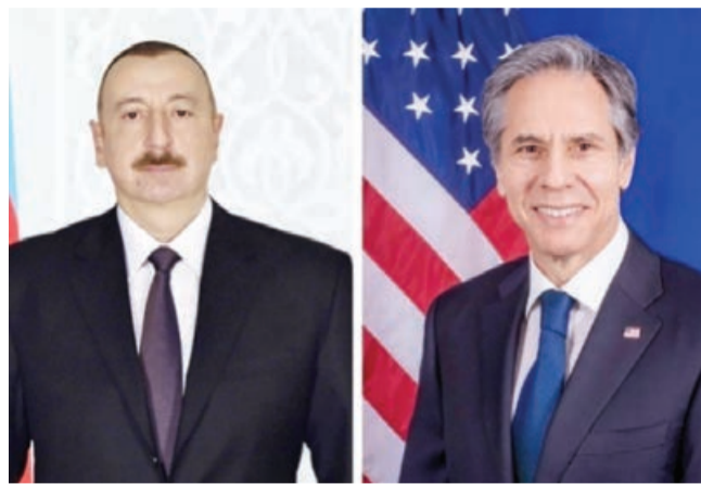
Sentyabrın 16-da ABŞ Dövlət katibi Entoni Blinken Azərbaycan Respublikasının Prezidenti İlham Əliyevə zəng edib.

Bölgəmizdə ədalətə və beynəlxalq hüquqa əsaslanan yeni reallıqlar və status-kvo yaranıb