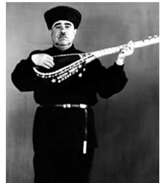
12 dastanı dillər əzbəri olan aşıqın 10 kitabı işıq üzünə gəlir.

1946-cı ildə Cənubi Azərbaycanda milli hökumət süqut edir. Tale onu yəniçən Arazin bu tayına gətirir. M.Maqomayev adına Azərbaycan Dövlət Filarmoniyasında solist kimi fəaliyyət göstərir. Böyük səhnədə çıxışı həsrətə qarşıdır. Respublika öz fəaliyyətini incəsənət festivalının laureatı olur, birinci dərəcəli diplom alır.