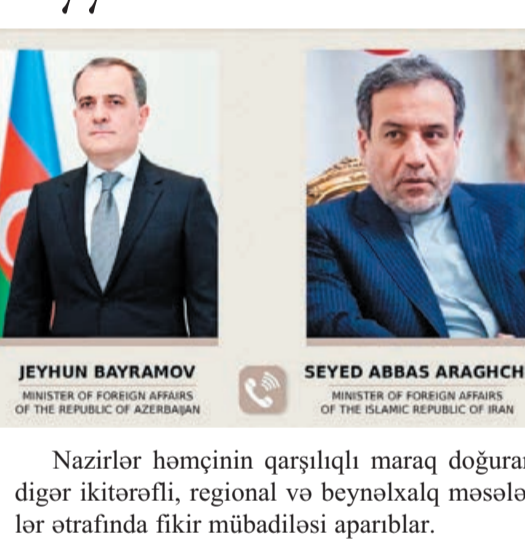
Nazirlər həmçinin qarşılıqlı maraq doğuran digər ikitərəfli, regional və beynəlxalq məsələlər ətrafında fikir mübadiləsi aparıblar.

Mayın 13-də Azərbaycanın xarici işlər naziri Ceyhun Bayramov ilə İranın xarici işlər naziri Seyid Abbas Əraçqi arasında telefon danışığı baş tutub. Azərbaycan Xarici İşlər Nazirliyindən AZƏRTAC-a bildirilib ki, telefon danışığı zamanı Azərbaycan-İran ikitərəfli əlaqələri, regionda mövcud vəziyyət və bu çərçivədə danışıqlar prosesinin gedişatı, İran ətrafında vəziyyətin diplomatik və siyasi həll perspektivləri ətrafında müzakirə aparılıb. Abbas Əraçqi danışıqlar prosesi barədə ötrafı məlumat verib. Ceyhun Bayramov münaqişənin sülh və danışıqlar yolu ilə həlli istiqamətində söylədi dəstək-lədiyimizi diqqətə çatdırıb.