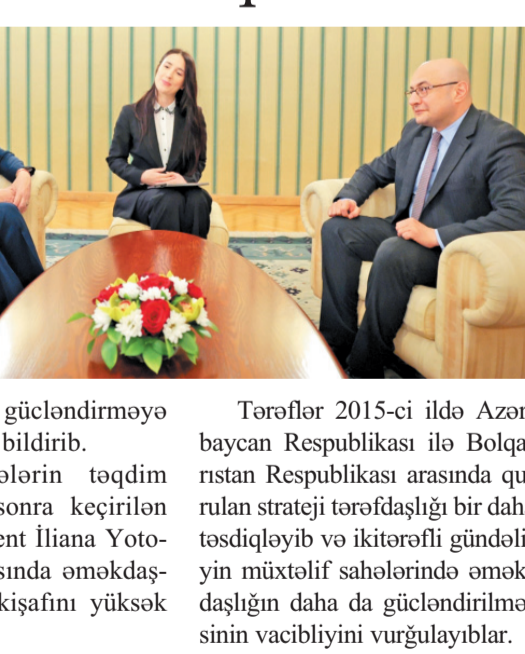
Tərəflər 2015-ci ildə Azərbaycan Respublikası ilə Bolqarıstan Respublikası arasında qurulan strateji tərəfdaşlığı bir daha təsdiqləyib və ikitərəfli gündəliyin müxtəlif sahələrində əməkdaşlığın daha da gücləndirilməsinin vacibliyini vurğulayıblar.