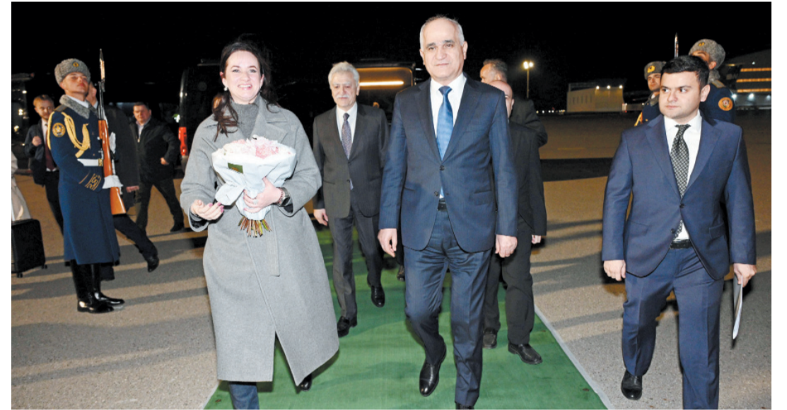
Litva Respublikasının Baş naziri İnqa Ruqiniene aprelin 8-də Azərbaycan Respublikasına rəsmi səfərə gəlib.

Hər iki ölkənin dövlət ne fəxri qarovul dəstəsi dü-bayraqlarını dağalandığı zülmüşdü. Heydər Əliyev Beynəlxalq Litvanın Baş naziri İnqa Aeroportunda qonağın şərfi-Ruqinienei hava limanında