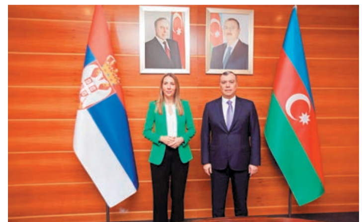
Aprelin 8-də Azərbaycan Respublikasının maliyyə naziri, Azərbaycan Respublikası ilə Serbiya Respublikası arasında ticarət və iqtisadi əməkdaşlıq üzrə Hökumətlərarası Komissiyanın həmsədri Sahil Babayev ölkəmizdə səfərdə olan Serbiya Respublikasının mədan və energetika naziri xanım Dubravka Djedović Handanoviçin rəhbərlik etdiyi nümayəndə heyəti ilə görüşüb.

Maliyyə Nazirliyindən verilən məlumata görə, görüşdə Azərbaycan ilə Serbiya arasında ikitərəfli əməkdaşlıq, o cümlədən enerji sahəsində əlaqələrin mövcud vəziyyəti və inkişaf perspektivləri müzakirə edilib.