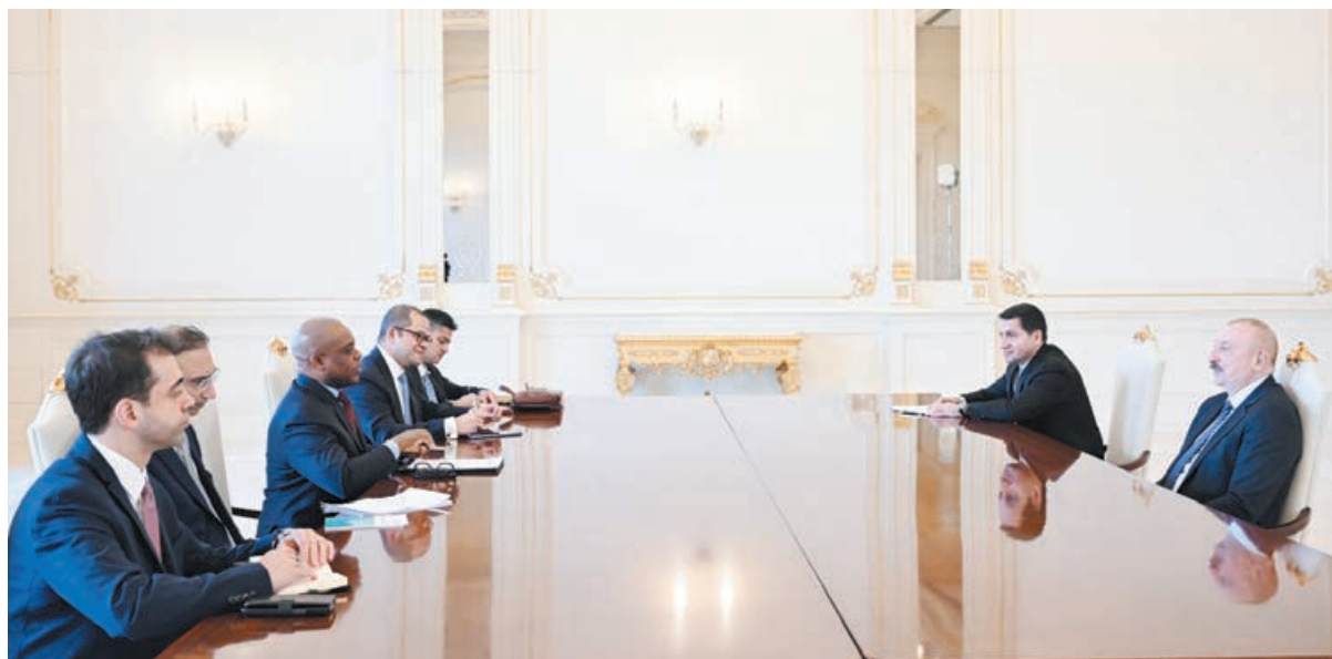
Əvvəlki 1-ci sah.

Prezident İlham Əliyev D-8 İqtisadi Əməkdaşlıq Təşkilatının Baş katibini qəbul edib