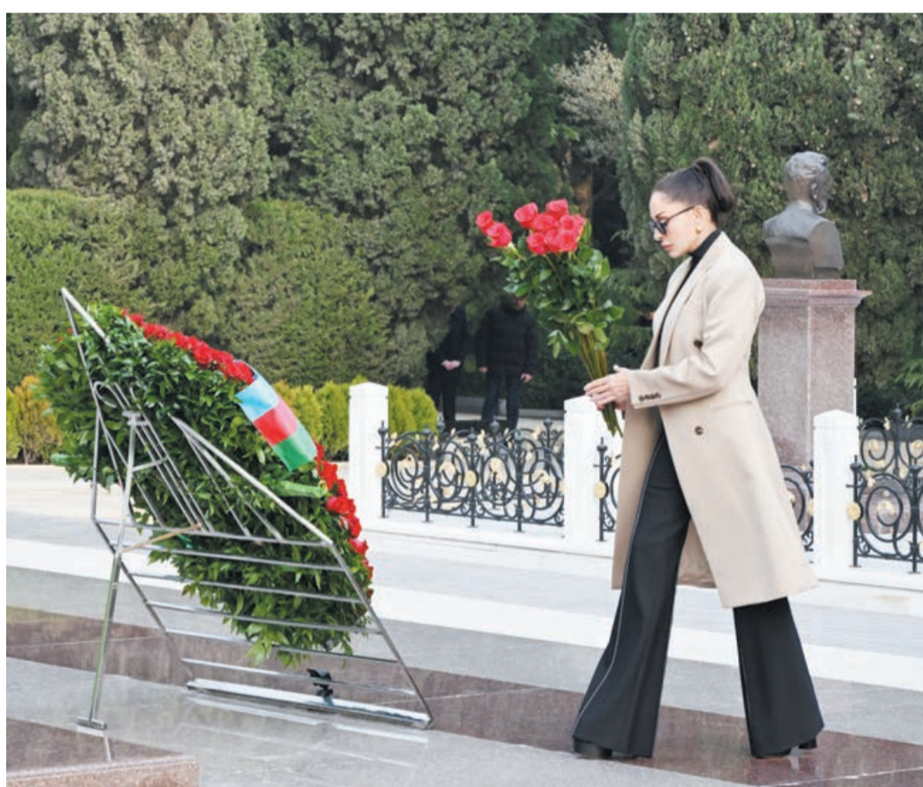
Müasir müstəqil Azərbaycan dövlətinin memarı və qurucusu, dünyaşöhrətli siyasi xadim, xalqımızın Ümummilli Lideri Heydər Əliyevin vəfatından 21 il ötür.

AZƏRTAC xəbər verir ki, dekabrın 12-də Azərbaycan Respublikasının Prezidenti İlham Əliyev və birinci xanım Mehriban Əliyeva Fəxri xiyabana gələrək xalqımızın Ümummilli Lideri Heydər Əliyevin məzarını ziyarət ediblər. Prezident İlham Əliyev Ulu Öndərin məzarı önünə