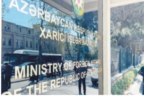
löt katibi Blinkenin rəhbərlik etdiyi ABŞ Dövlət Departamentinin Azərbaycanın daxili işlərinə müdaxilə ilə məşğul olması səbəbindən sözügedən dövr bir çox dö-

AZƏRTAC xəbər verir ki, bu barədə Xarici İşlər Nazirliyinin Mətbuat xidməti idarəsinin rəisi Ayxan Hacızadənin ABŞ Dövlət katibi Entoni Blinkenin Azərbaycan əleyhinə bəyanatına dair şərhində bildirilib. "Təəssüf ki, son 4 il ərzində Dövlət katibi Blinkenin rəhbərlik etdiyi ABŞ Dövlət Departamentinin Azərbaycanın daxili işlərinə müdaxilə ilə məşğul olması səbəbindən sözügedən dövr bir çox dö-