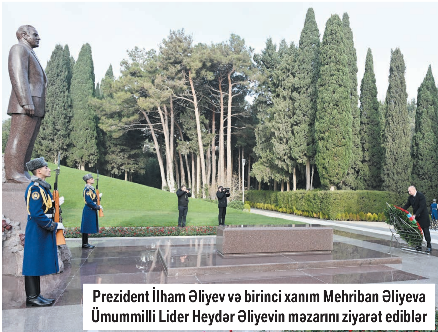
Prezident İlham Əliyev və birinci xanım Mehriban Əliyeva Ümummilli Lider Heydər Əliyevin məzarını ziyarət ediblər