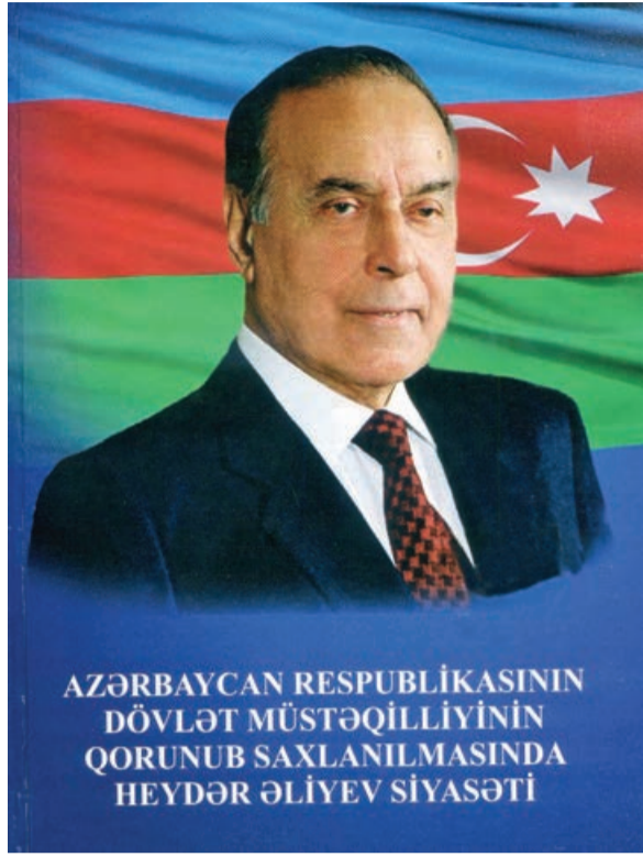
AZƏRBAYCAN RESPUBLİKASININ DÖVLƏT MÜSTƏQİLLİYİNİN QORUNUB SAXLANILMASINDA HEYDƏR ƏLİYEV SİYASƏTİ

Kitabda xüsusi olaraq vurğulan ki, 1991-1993-cü illərin böhranlı günləri, ölkədə ictimai xaosun, siyasi hakimiyyətsizliyin geniş miqyaslı cəmiyyətdə