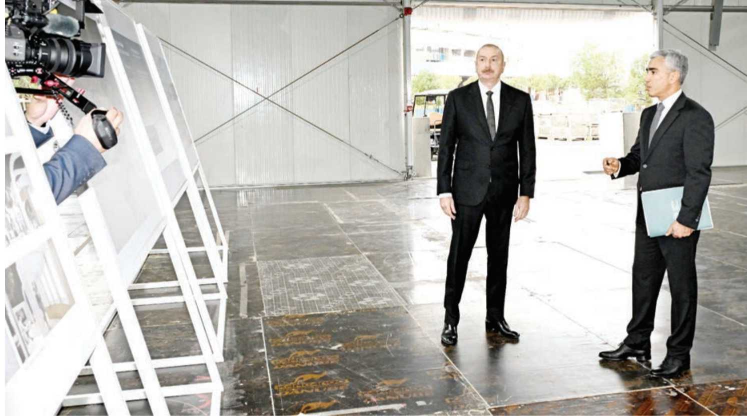
Azərbaycan Respublikasının Prezidenti İlham Əliyev oktyabrın 17-də Bakı Olimpiya Stadionunun ərazisində COP29-a hazırlıqla bağlı görülən işlərlə tanış olub.

AZƏRTAC xəbər verir ki, Prezidentin köməkçisi Anar Ələkbərov dövlətimizin başçısına COP29 məkanının tədbirə hazırlıq vəziyyətinə gətirilməsi barədə məruzə etdi.