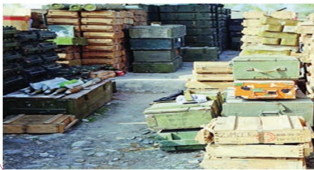
Rəşad BAXŞƏLİYEV, "Azərbaycan"

Saat 12:30-da cəbhənin Cəbrayıl istiqamətində Azərbaycan Ordusunun mövqelərinə